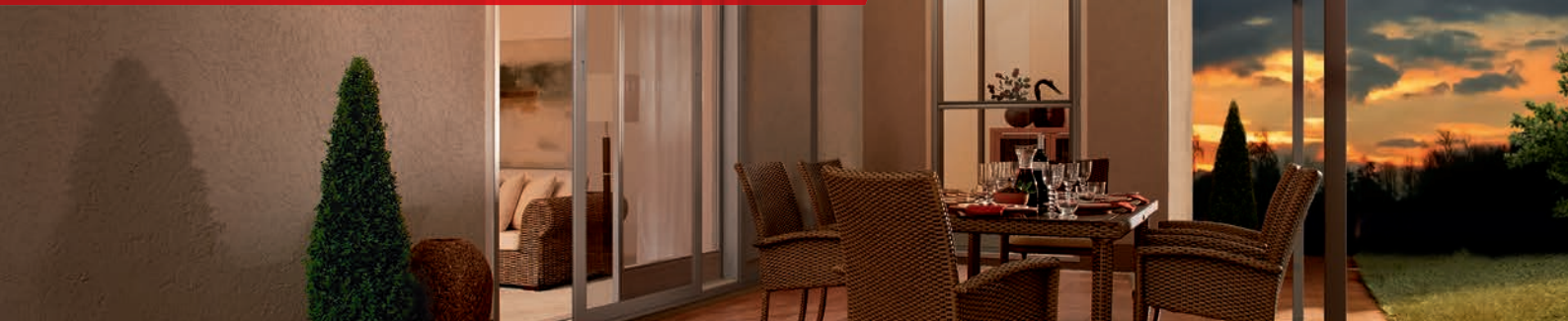
Pergola-Markise P40, gebogene Führungsschienen